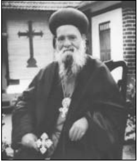
ത്തിന്റെ മെത്രാപ്പോലീത്തയായി അദ്ദേഹം മൂന്ന് വ്യായാസക്കാലം പ്രവർത്തിച്ചു. ഒരു വർഷക്കാലം പര്യടന സെമിനാരിയുടെ ഭരണവും നിർവ്വഹിച്ചു.